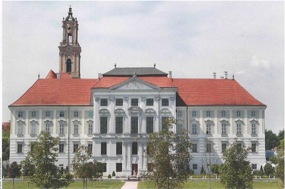
Prächtig: Das Stift Herzogenburg ist ein echtes Barockjuwel.

Nußdorf kommt dem Ideal eines Weindorfs nahe. Mit hübschen Bürgerhäusern und Weinkellern entlang der schmalen Straßen, die hinauf zu den Hügeln mäandern. Heute große Oper, wenn der Nebel vor der Sonne verduftet. Weingärten, Marillen-, Apfel- und Dirndlbäume flammen im Licht auf. Wer höher hinaus will, wandert zum Eichberger Korkenzieher. 15 Meter hoch ragt der Aussichtsturm mit Weit- und Weinblick, der zwei Talente vereint: Er ist Ort des meditativen Riedenschauens und Ort der Lebensfreude, Hochzeitspaare sagen hier gerne Ja. Aber nur im Sommer, jetzt hat die Stille das Sa-