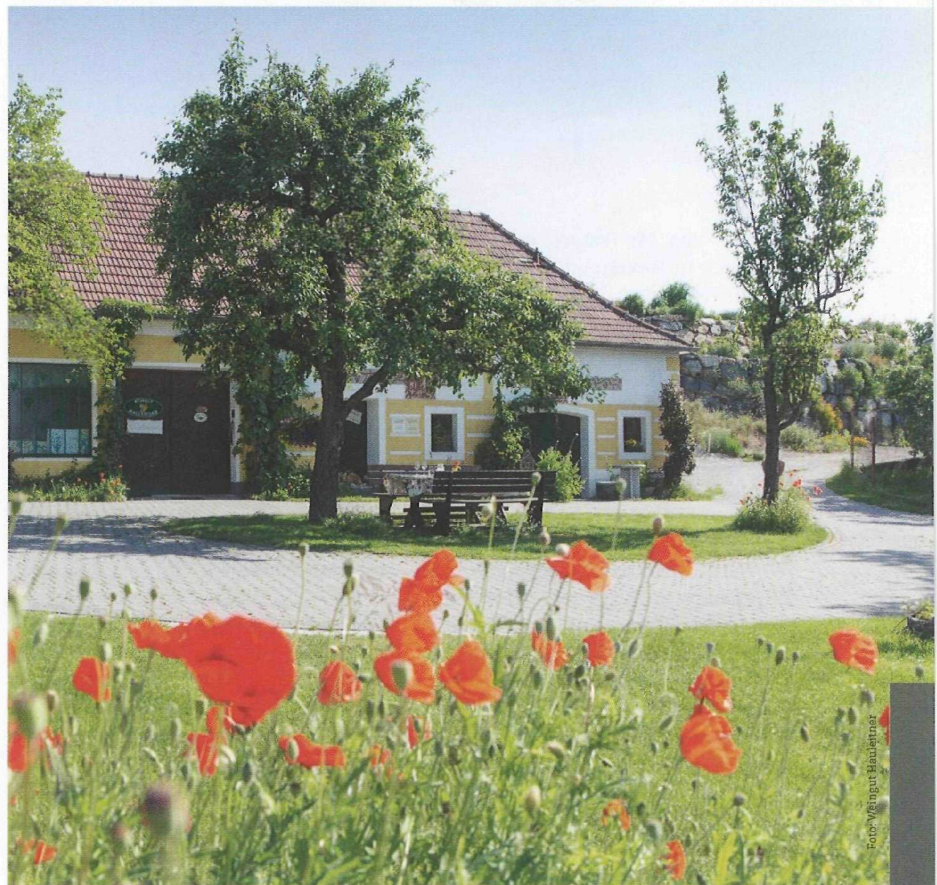
Vorbildlich renoviertes Betriebsgebäude am Weingut Hauleitner.

Die Produkte dieser Wetter- und Bodenküche gehen zu 65 Prozent in den Export, besonders beliebt ist der „groone