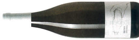
★★★★★ Josef Fritz 2019 Tertiär „S“ Sauvignon Blanc