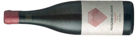
★★★★★ Hajszan Neumann 2016 Traminer Natural