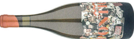
★★★★ Taubenschuss 2018 Roter Traminer Pontic