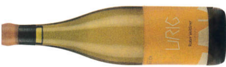
★★★★ Familie Bauer 2018 Roter Veltliner Urig