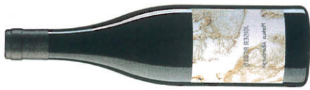
★★★★★ Markus Altenburger 2019 Joiser Reben (TR/WR/MO)